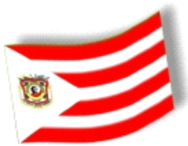
Nuestra bandera, orgullo galanista